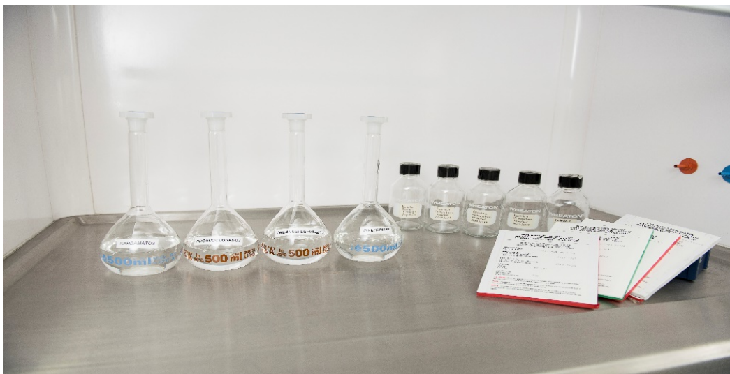
Figura 3 Metodologías OMS y CDC para determinar Resistencia a insecticidas

Existen dos métodos más utilizados para la detección de resistencia son: el método de papeles impregnados propuesto por la Organización Mundial de la Salud (4) y el de botellas de vidrio impregnadas, estandarizado por el Centro para el Control y Prevención de Enfermedades de Estados Unidos (5).