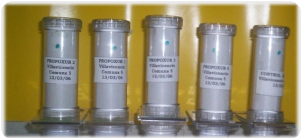
Figura 4 Montaje de bioensayo con Tubos OMS

La metodología OMS, utiliza papeles impregnados con insecticida que actúan como matriz, sobre la cual se exponen los mosquitos adultos durante un tiempo único de una hora (con excepción del organofosforado fenitrotion al cual se exponen durante 2 horas (4) y posteriormente de un tiempo de reposo de 24 horas, se lee la mortalidad.