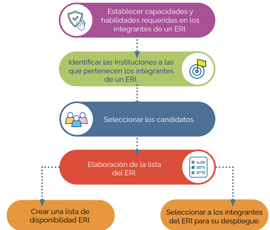
Figura 1. Proceso de selección de candidatos ERI:

Una vez identificada la emergencia a la que se va a responder, la selección de los integrantes del ERI puede estar basada en las necesidades de la respuesta y sus habilidades (ver figura 1). En niveles subnacionales generalmente se articulan acciones de vigilancia con programas de control tales como Plan Ampliado de Inmunizaciones, Enfermedades transmitidas por vectores o zoonóticas, Salud ambiental, laboratorios de referencia, entre otros. Se debe valorar que los ERI también cuenten con personal de estas áreas.